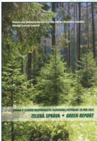
Zelená správa – Green report

Štefančík, I. – Bednárová, D. ISBN 978-80-8093-222-0