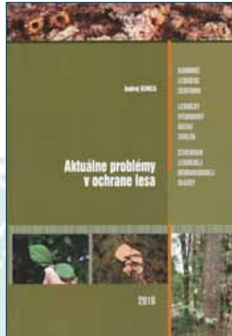
Aktuálne problémy v ochrane lesa