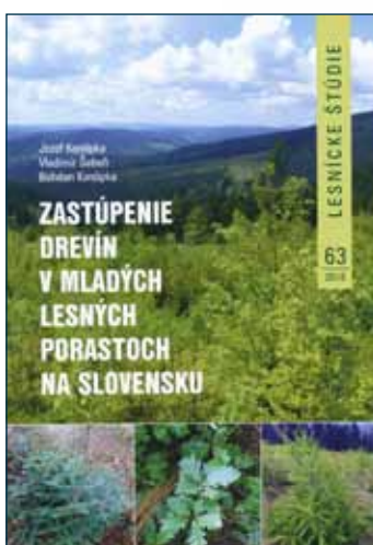
Zastúpenie drevín v mladých lesných porastoch na Slovensku

Kovalčík, M. – Moravčík, M. (eds.) ISBN 978-80-8093-225-1