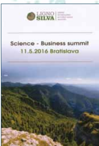
Lignosilva Science – Business summit

Konôpka, J. a kol. ISBN 978-80-8093-224-4