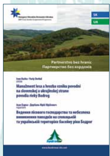
Manažment lesa a hrozba vzniku povodní na slovenskej a ukrajinskej strane povodia rieky Bodrog

Barka, I. – Derbaľ, J. (eds.) ISBN 978-80-8093-211-4