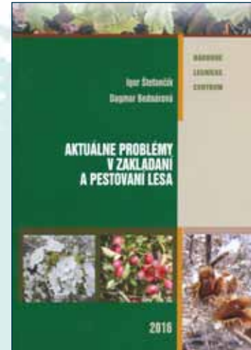
Aktuálne problémy v zariadení a pestovaní lesa

Štefančík, I. – Bednárová, D. ISBN 978-80-8093-222-0