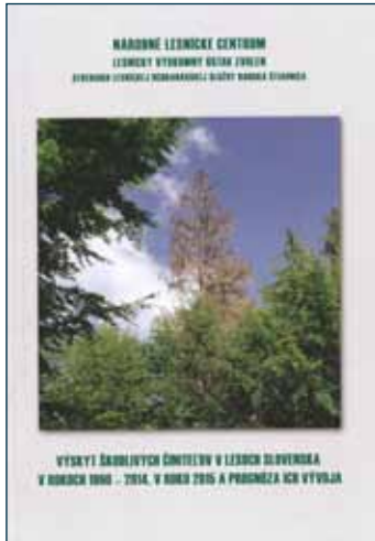
Výskyt škodlivých činiteľov v lesoch Slovenska v rokoch 1960 – 2014, v roku 2015...