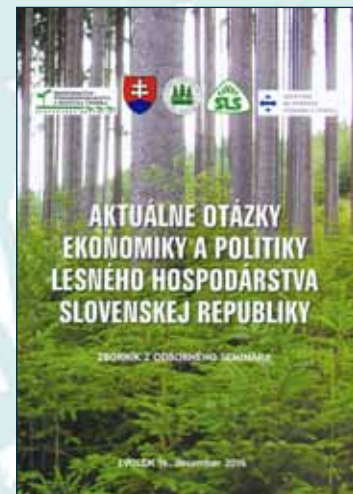
Aktuálne otázky ekonomiky a politiky lesného hospodárstva Slovenskej republiky

Bruchánik, R. a kol. ISBN 978-80-8093-226-8